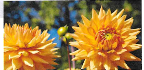
Liebe Senioren! - Herzlich Willkommen!

Die Seniorenclubleitung lädt alle Frauen und Männer ab 60 Jahren zu den monatlichen Seniorentreffen herzlich ein. Wer Lust hat in geselliger Runde frohe Stunden zu erleben mit Singen, Karten, Spiel und Spaß, bei Feiern, Ausflügen, Vorträgen, Gedächtnistraining, Bewegungsgymnastik und anderem, ist im Seniorenclub am richtigen Platz. – Jeder ist willkommen! – Auf Euer zahlreiches Mitmachen freut sich die