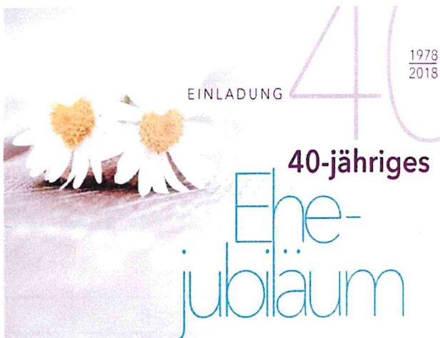
Alles Gute zum 40-jährigen Ehejubiläum!