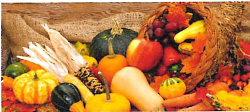
Danke für alle Gaben die wir haben.

„Ich will dem Herrn von ganzem Herzen danken, den heiligen Gott mit meinem Lied besingen. Durch seine Gaben sorgt er für mein Leben.“